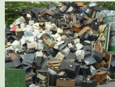
ELEKTROMOS és ELEKTRONIKAI BERENDEZÉSEK